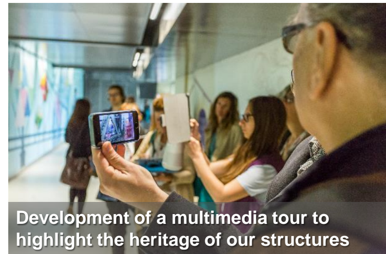
Development of a multimedia tour to highlight the heritage of our structures