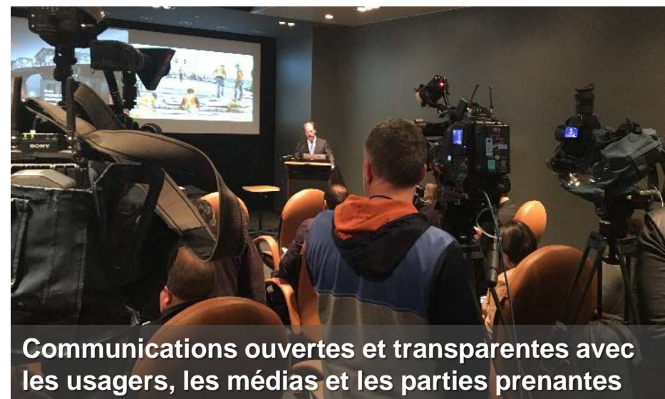
Communications ouvertes et transparentes avec les usagers, les médias et les parties prenantes