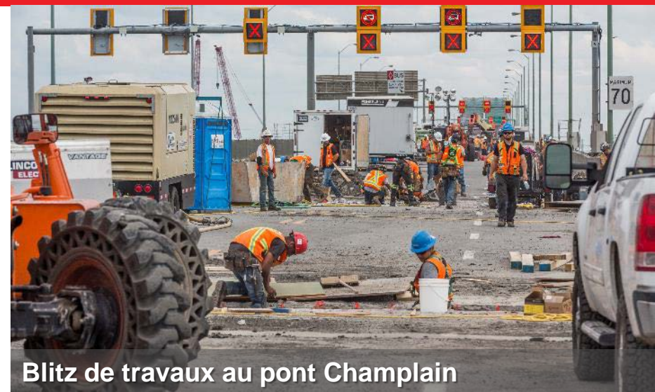
Blitz de travaux au pont Champlain