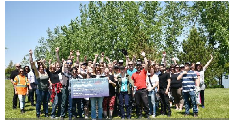
Employee activity to clean the shore during the Semaine du Saint-Laurent